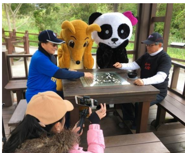
清交校長同框拍攝宣傳短片，為邁入50年的兩校盛事梅竹賽宣傳造勢。