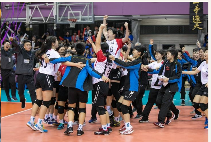
女排勝利瞬間，球員興奮、感動抱成一團。