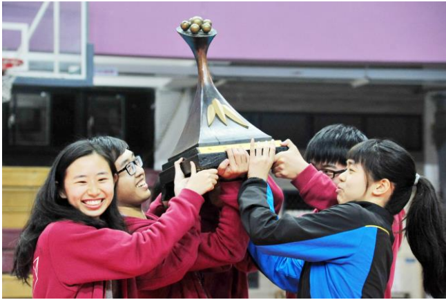
清華奪得梅竹總錦標，學生們開心舉起大獎盃。