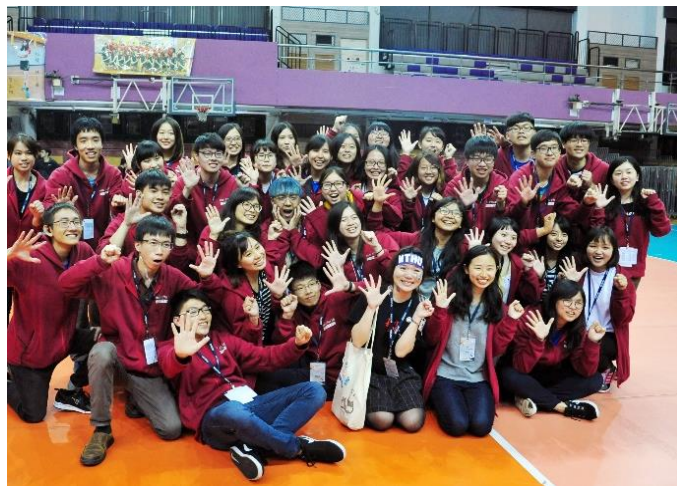
梅竹幕後英雄-梅竹籌備委員會，閉幕後開心大合影。