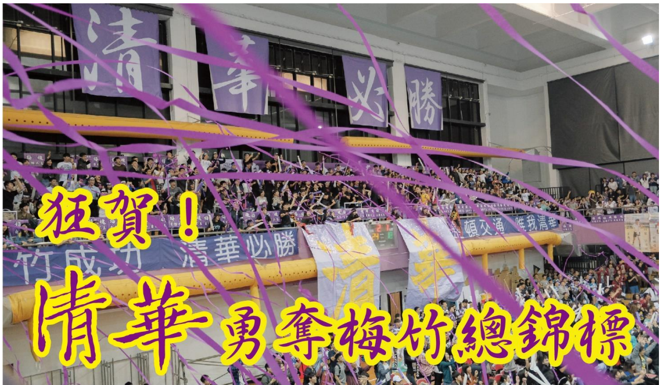
梅竹成功，清華必勝！狂賀清華勇奪梅竹總錦標。