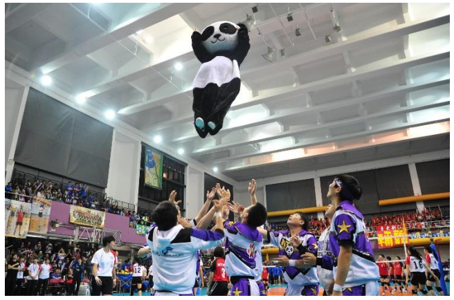
梅竹賽事精彩，串場表演也不遑多讓，啦啦隊拋起本校吉祥物熊貓，博得滿堂彩。