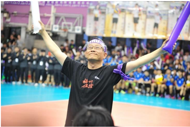
賀陳校長手舉加油棒，在場邊為校隊選手加油。