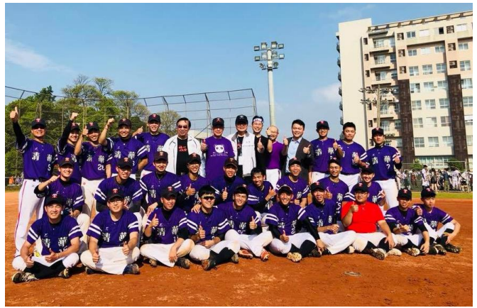
清華棒球以比數 12:2 獲勝。