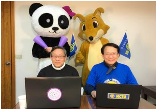
兩校校長聯袂拍攝趣味短片，為梅竹賽宣傳造勢。