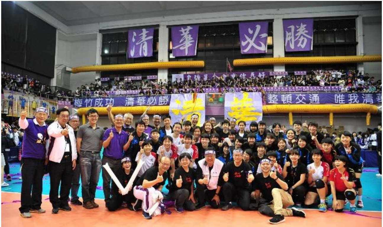
梅竹成功，清華必勝！狂賀清華勇奪梅竹總錦標。