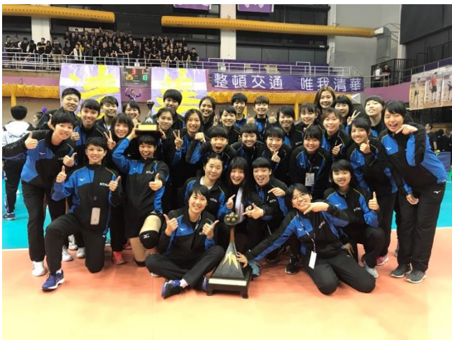
清華女排優異表現，助本校拿下戊戌梅竹總錦標。