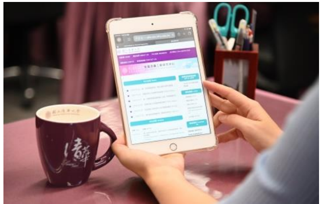
本校安富金融工程中心將於每個月第四周禮拜四公布即時房價指數。