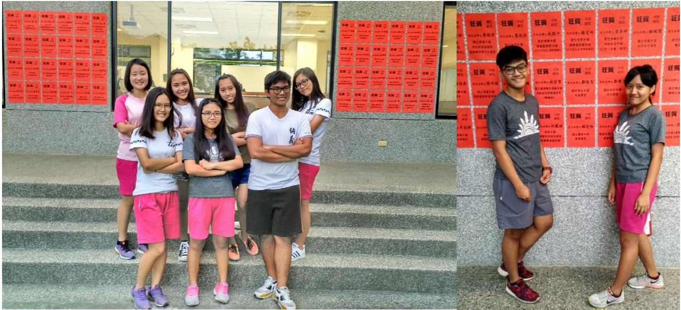
小清華原民班今年有 7 位學生錄取大學醫護科系，未來要以所學奉獻原鄉。