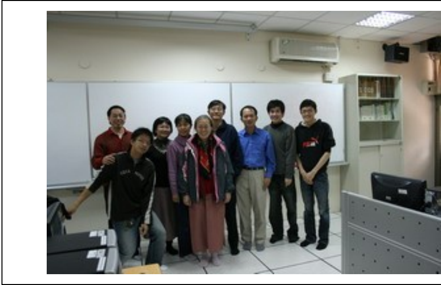
最後一次室內活動，社群老師們與助理及學生合照。