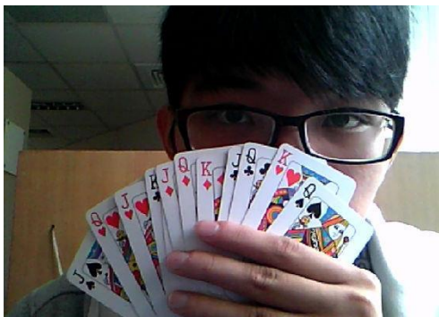
說明：遊戲用撲克牌