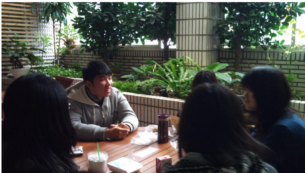
（看完電影的 TEA TIME 時間）