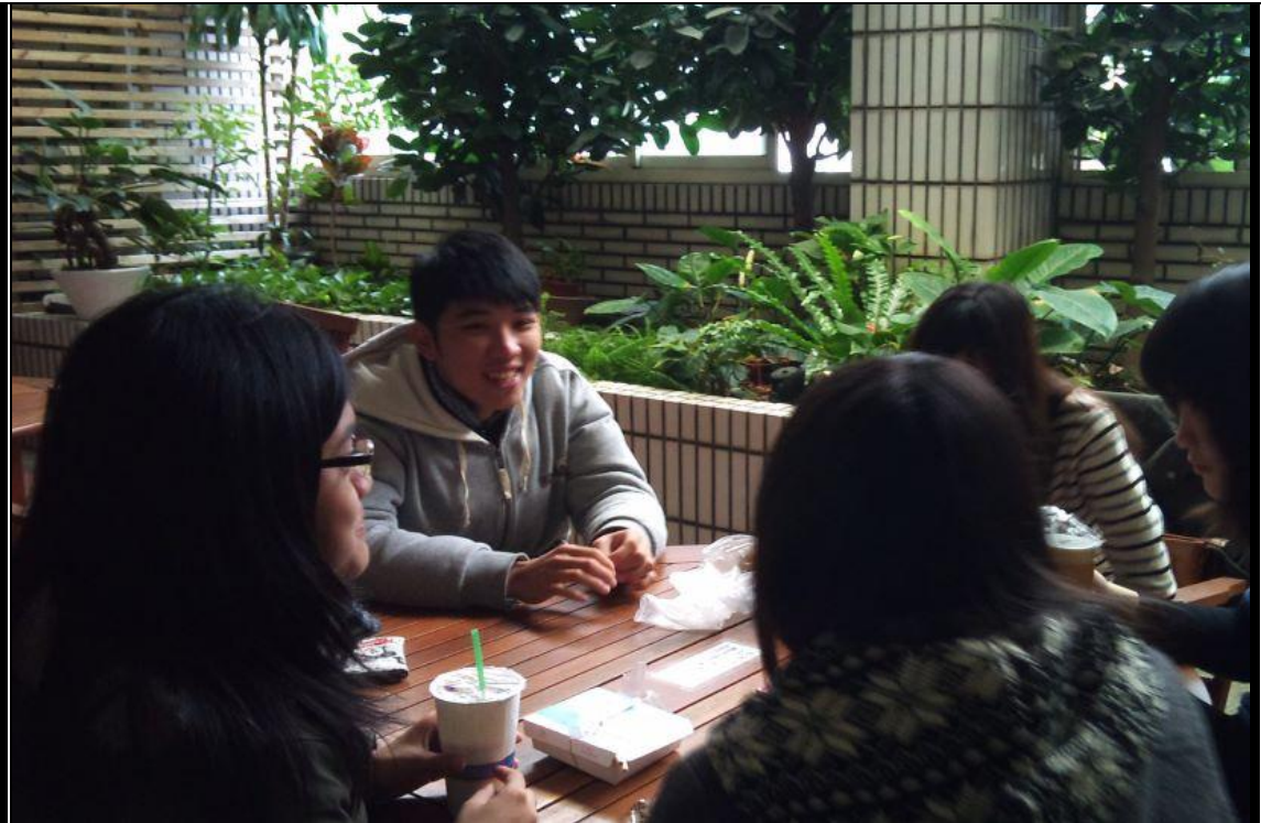
(昱鈞正在詢問有關台南參訪的細節)