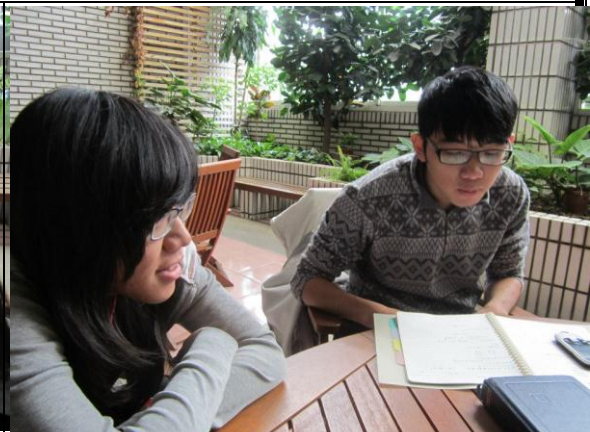
說明：舉行時間投票前的討論