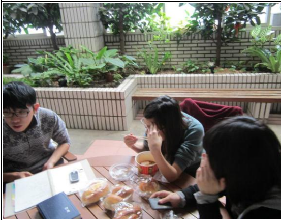
說明：正在說明進行方式