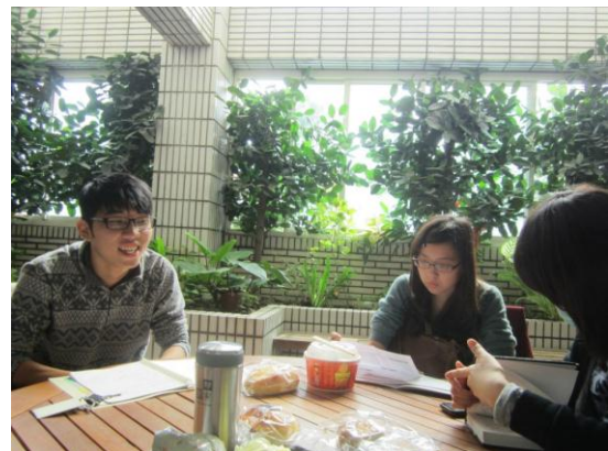
說明：權力之星設計規則