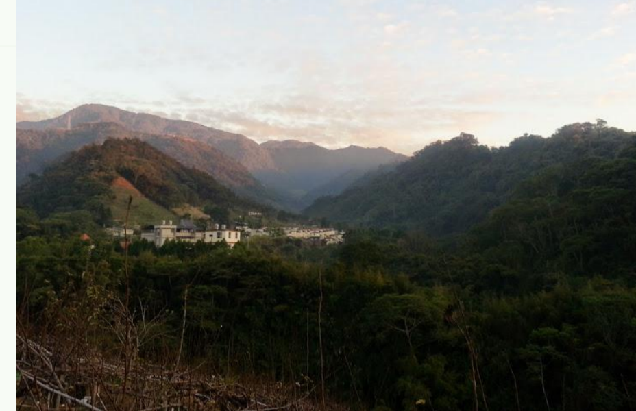
位於山谷之間的三叉坑部落