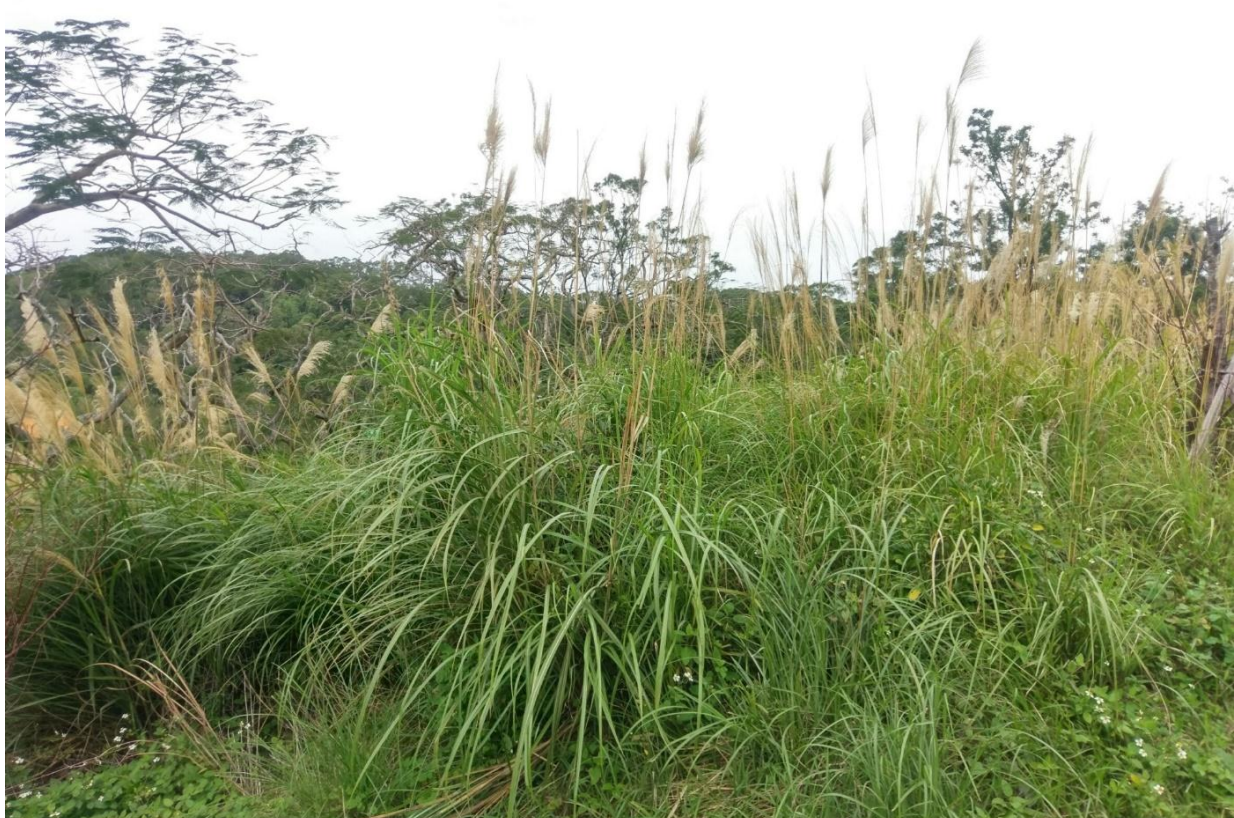
閒置土地，缺乏利用