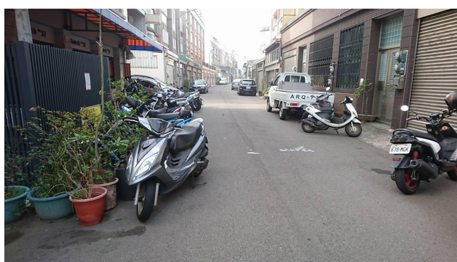
機車亂停，阻礙道路通行