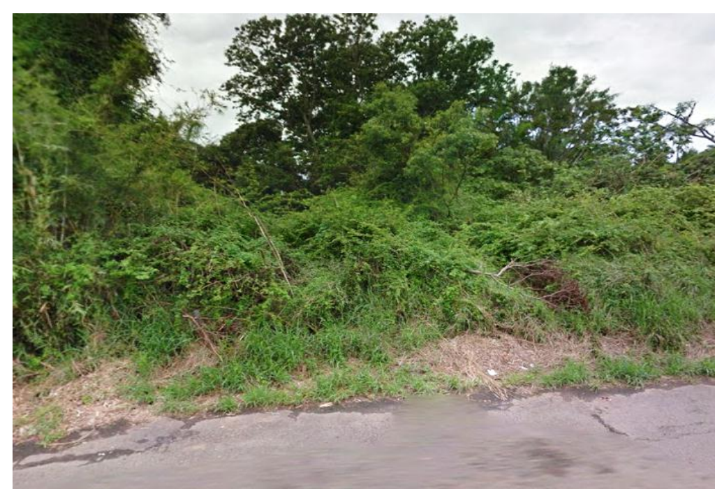
雜草叢生，妨礙交通