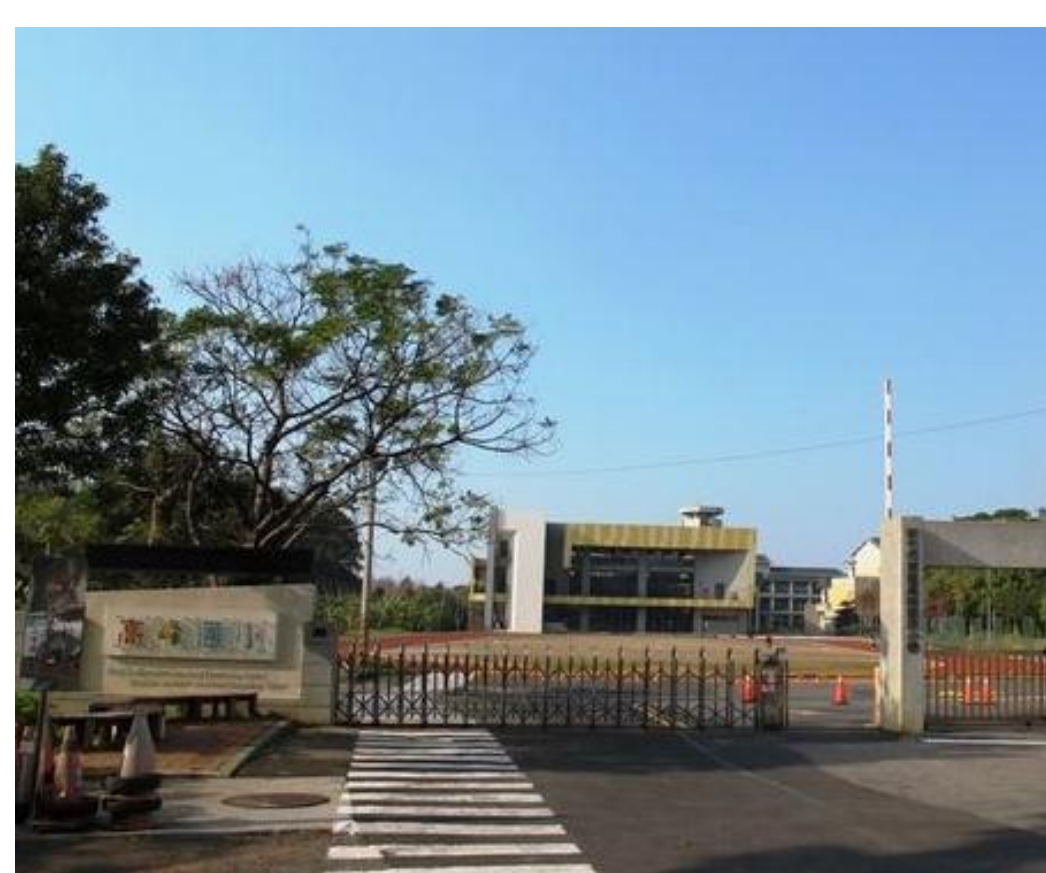
國小兒童等候區缺乏遮雨棚