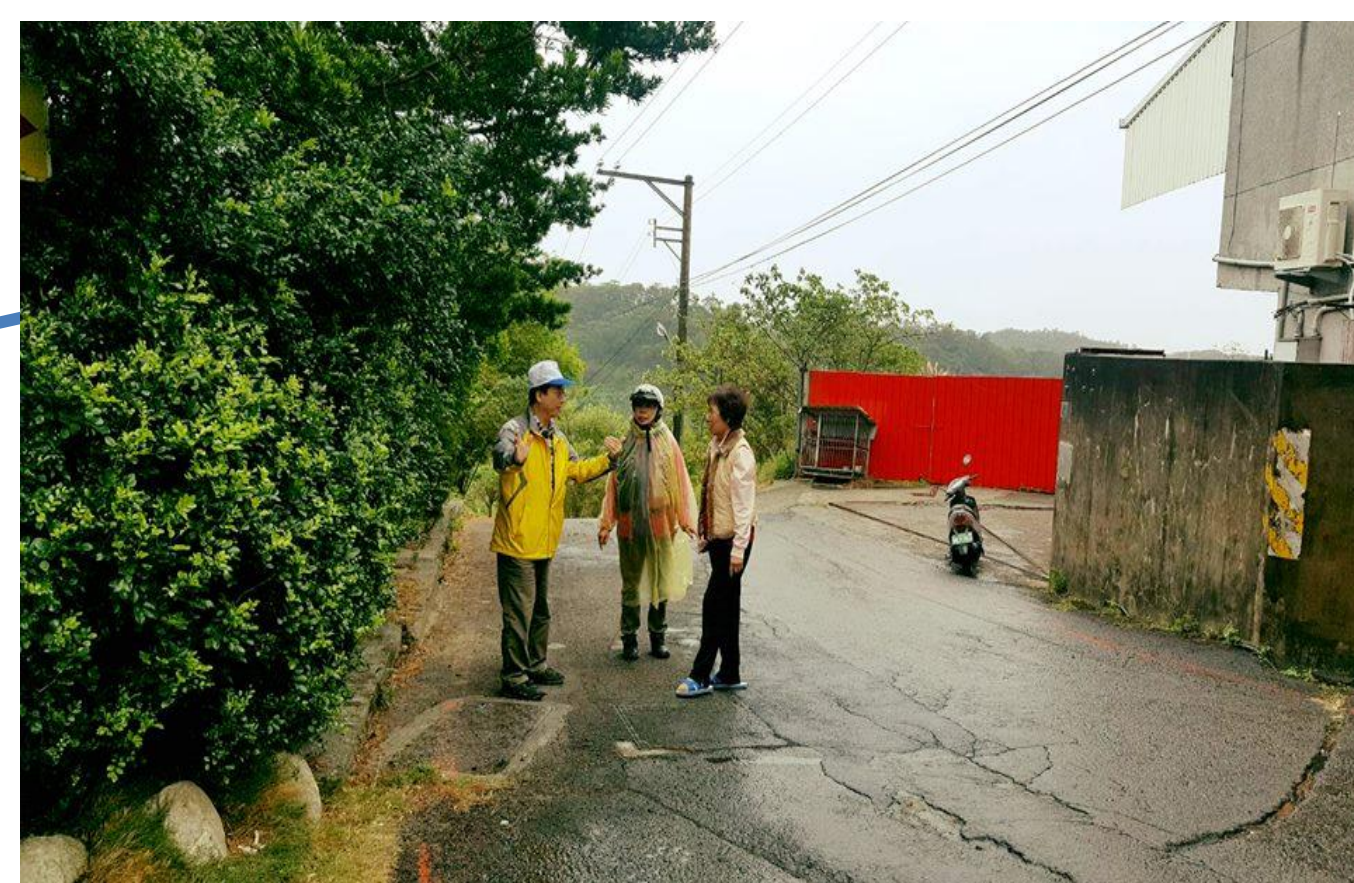
道路狹窄，視角很小