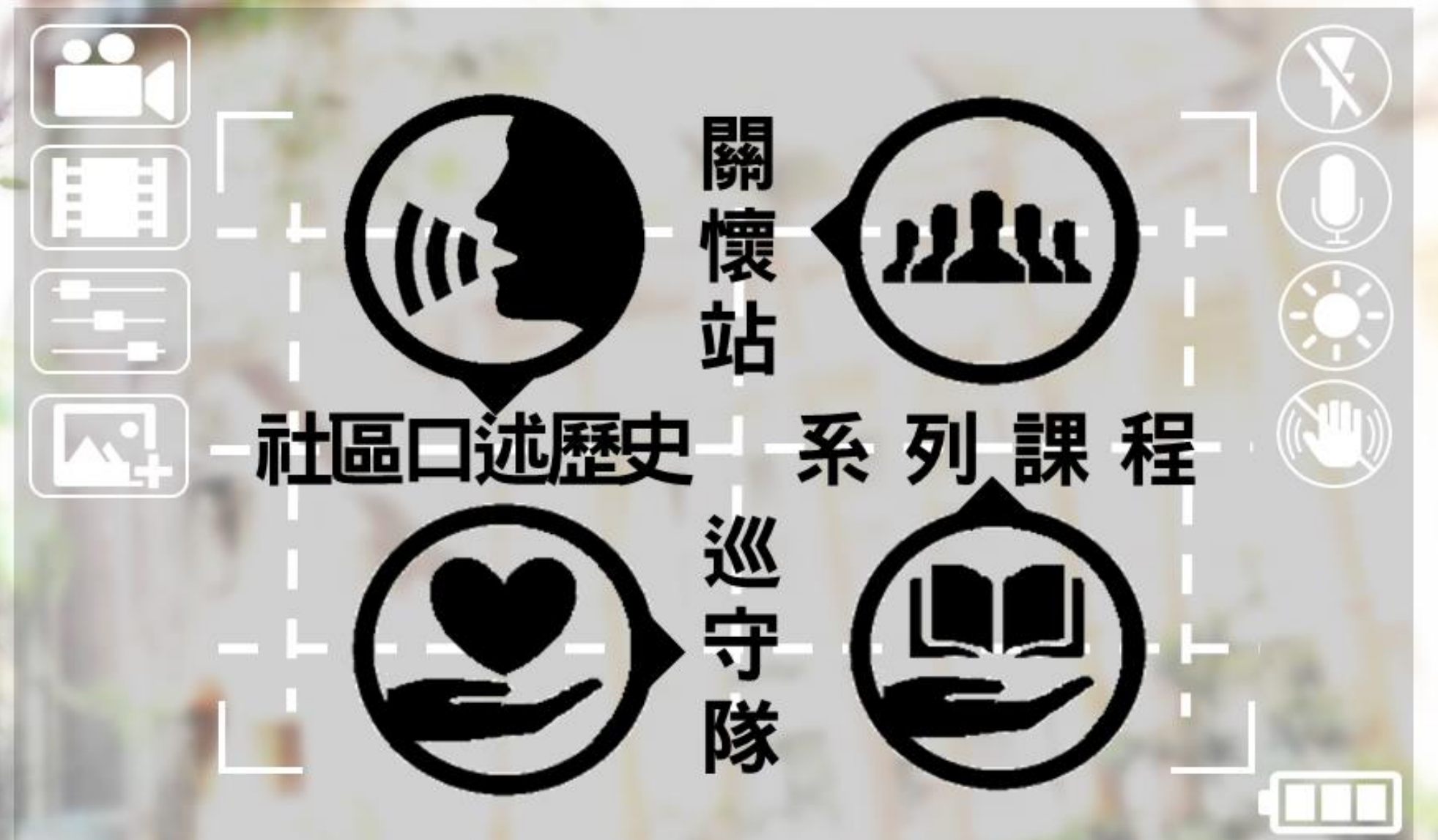
製圖 By 喬弘如

民富社區是位於新竹市北區的典型都市型社區，除公共建設外腹地主要為商業及住宅使用。民國七十九年至八十八年曾發展新竹地方知名之觀光夜市區，然而隨著搬遷，社區繁景日漸蕭條沒落。