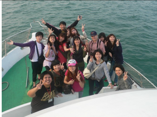
搭船進行高雄港產業考察時合影