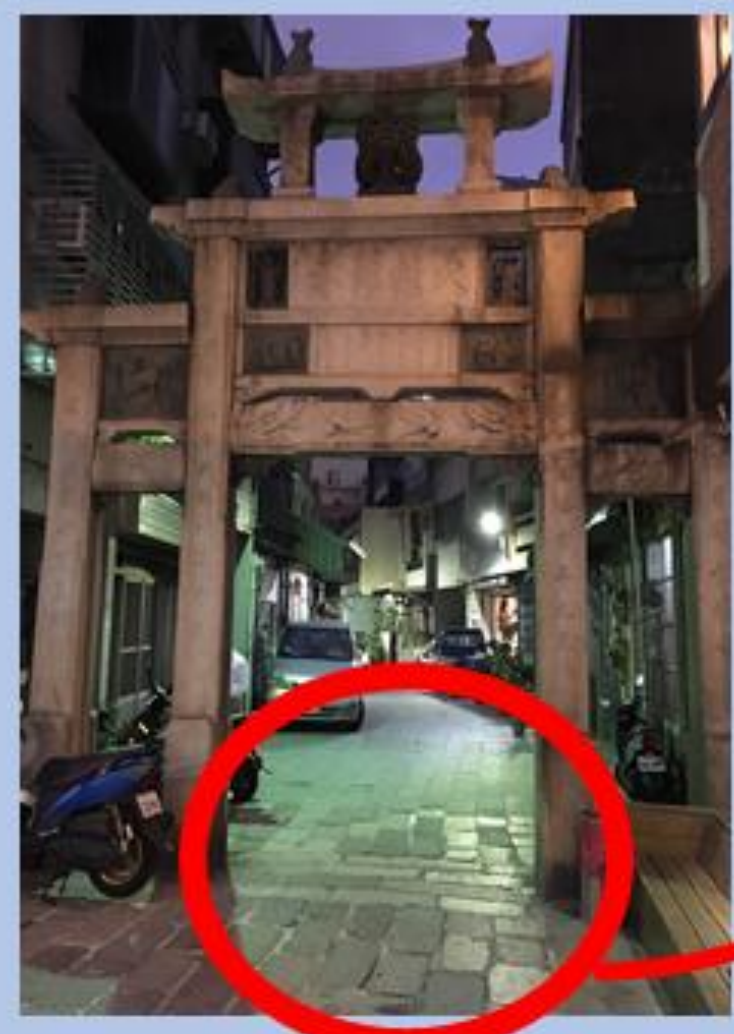
大貨車從牌坊進入，導致地板鋪面嚴重損毀