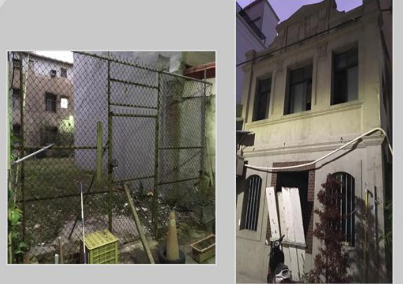
私人空地、住宅雜亂閒置