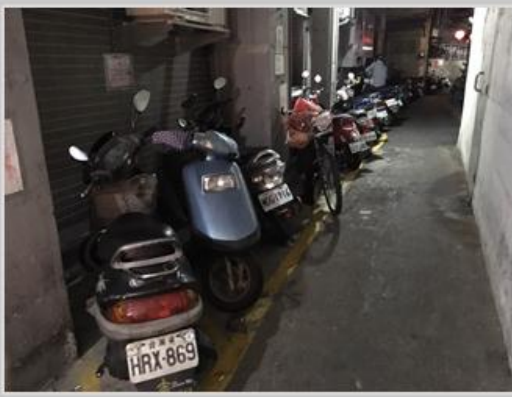
車輛隨意停放，佔據原本就很狹窄的道路