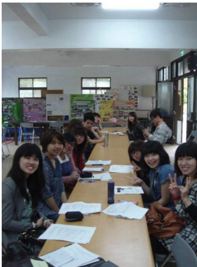
修課學生與理事長同坐一桌，進行多對一的問答諮詢方式。