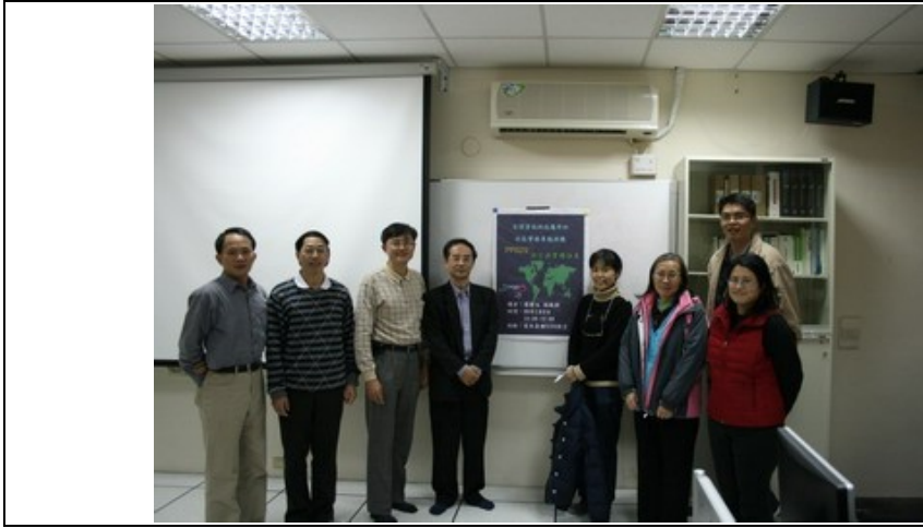
社群老師與蔡老師合照。