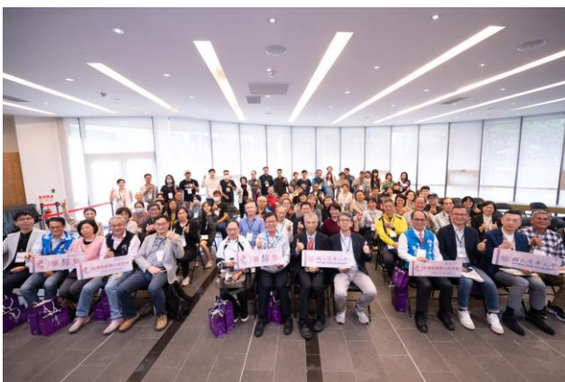
本校與社區伙伴今天一同發表在地實踐成果。