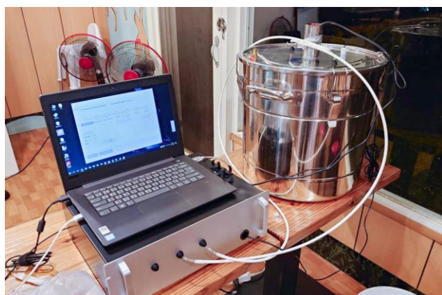
馬武督咖啡農使用本校電機系鄭桂忠教授的電子鼻技術，檢測咖啡豆發酵酸度，以提升咖啡風味。