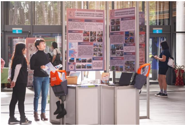
校內舉辦在地實踐成果展，展期至 12 月 22 日。