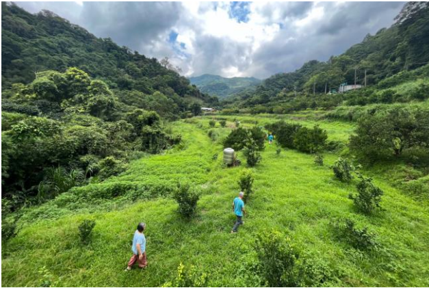
新竹關西馬武督咖啡園的美麗風光。