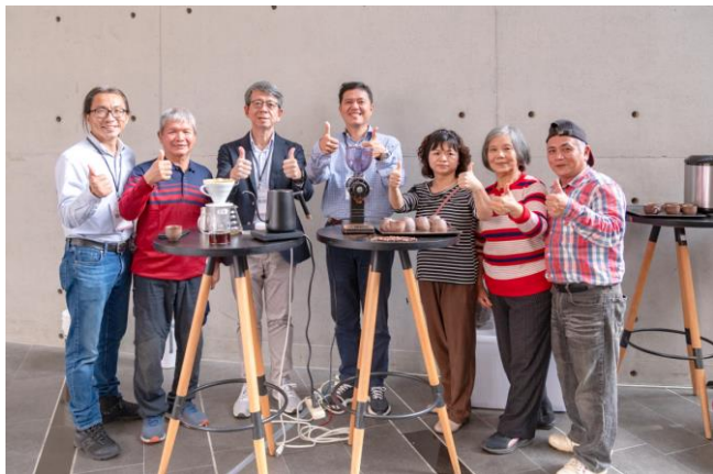
本校團隊協助新竹關西馬武督農民發展特色咖啡產業。

計畫團隊、超高齡社會的共伴共榮－以跨世代對話打造社會永續及韌性計畫團隊，及新竹文史接地計畫團隊。