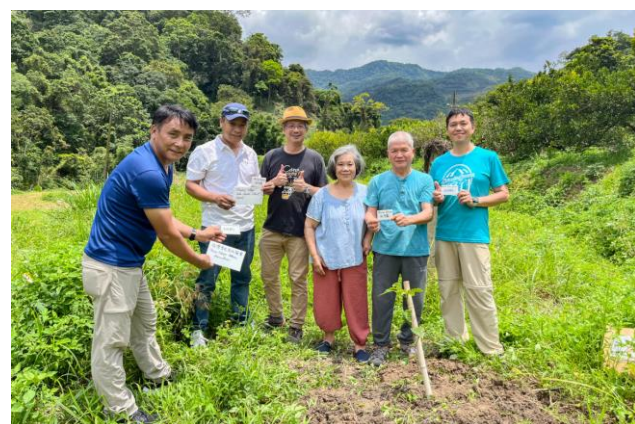
尼泊爾雪巴農民(左一及左二)來新竹向馬武督咖啡農取經。