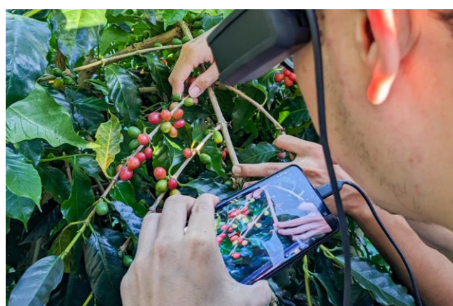
本校資工系黃能富教授以 AI 辨識技術結合智慧眼鏡，教學童分辨咖啡豆是否成熟適合採收。