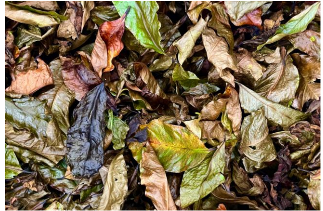
本校團隊協助馬武督農民開發特色商品，將咖啡葉做成咖啡葉茶。