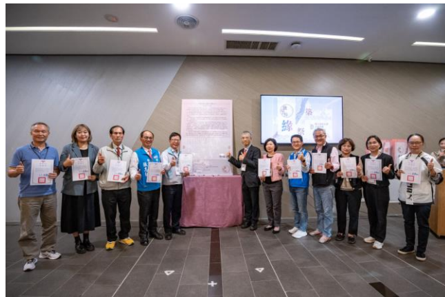
本校攜手在地實踐伙伴一同簽署「大新竹地方創生行動宣言」。