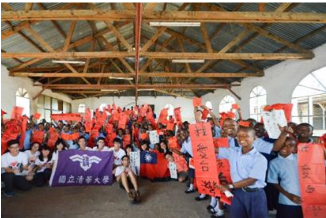
本校今年校慶將為支持學生海外志工服務發起「新地平線」永續基金募款活動。