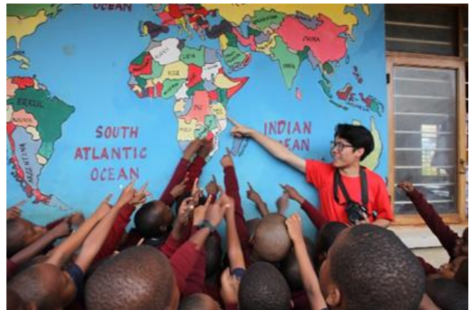
本校今年校慶將為支持學生海外志工服務發起「新地平線」永續基金募款活動。