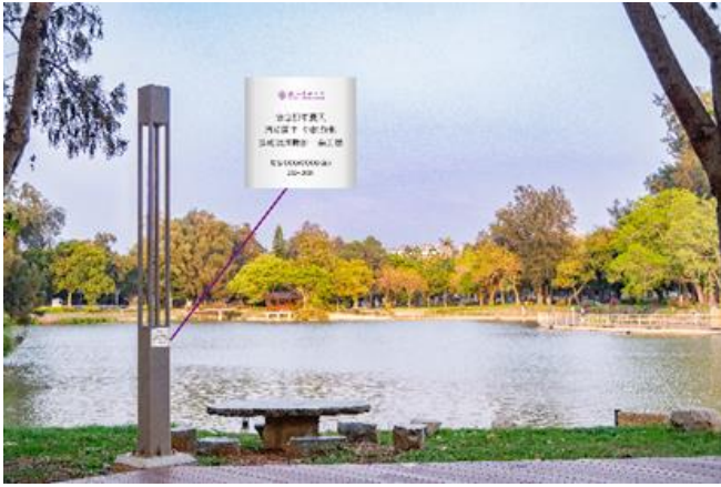
本校邀請贊助人在成功湖畔立燈鑲嵌銘牌，留下字句及名字。