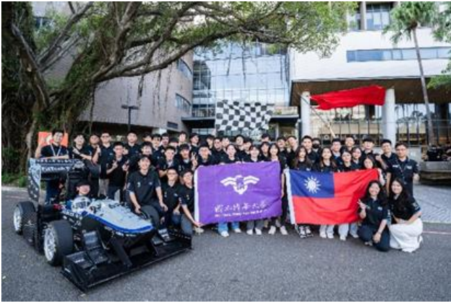
本校今年校慶將為支持學生參與國際競賽發起「新地平線」永續基金募款活動。