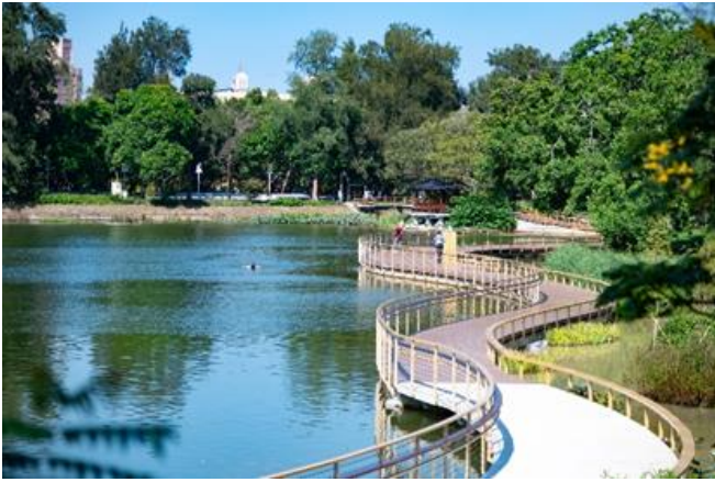
本校今年校慶將為成功湖生態營造及環境維護計畫發起募款活動。