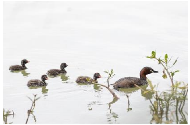
本校今年校慶將為成功湖生態營造及環境維護計畫發起募款活動。