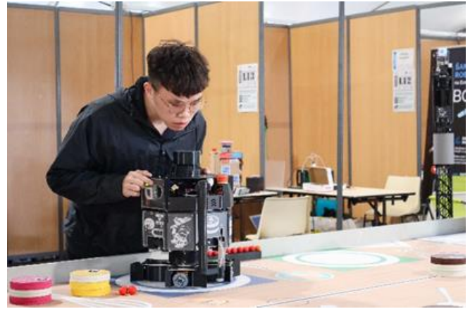
本校今年校慶將為支持學生參與國際競賽發起「新地平線」永續基金募款活動。