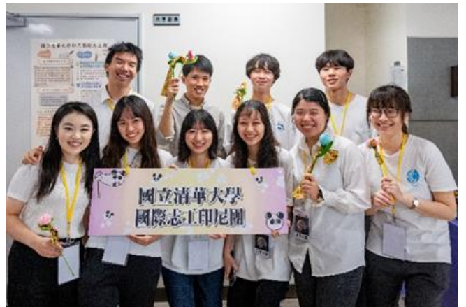
本校國際志工團即將出發前往印尼服務。