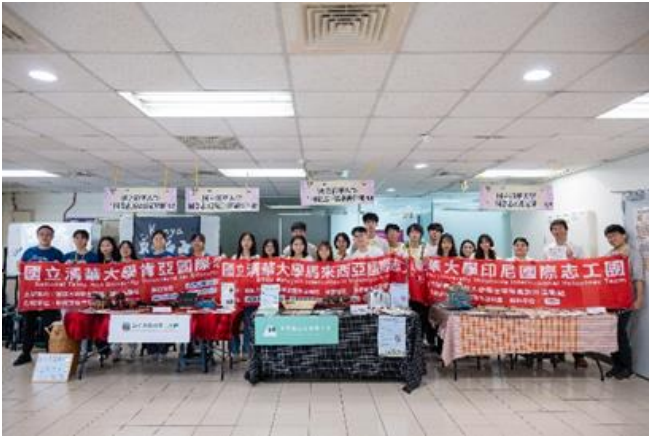
本校國際志工團即將出發前往肯亞、馬來西亞及印尼服務。