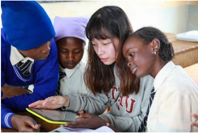
本校國際志工教肯亞學生使用平板查找資訊。