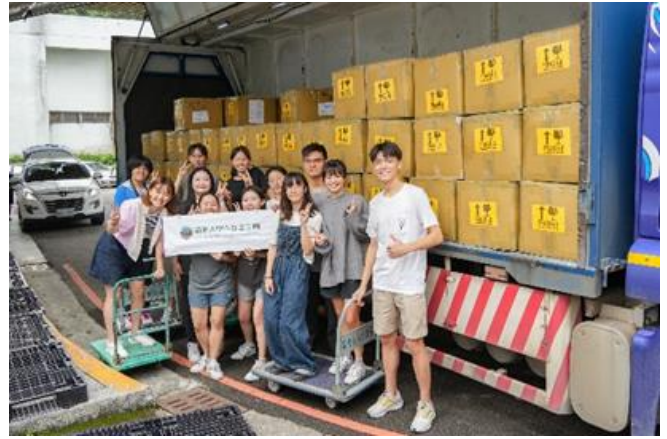
本校肯亞志工團在出發前先打包並海運 2 百多台二手電腦，送往肯亞及坦尚尼亞。