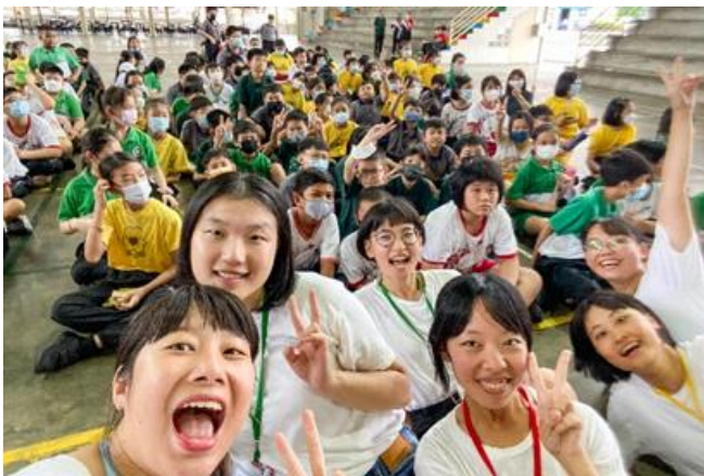
本校馬來西亞志工團到北干那那育民小學服務。