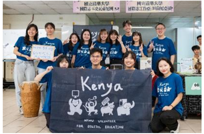
本校國際志工團即將出發前往肯亞服務。