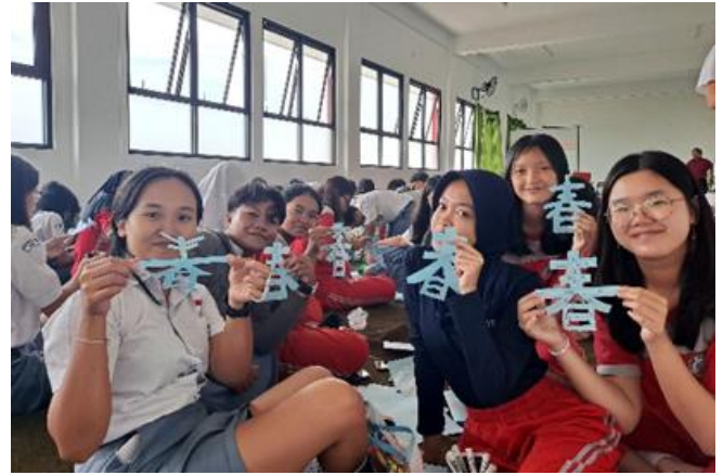
本校國際志工團今年初派出先遣團到印尼，教培德學校的學生剪紙。