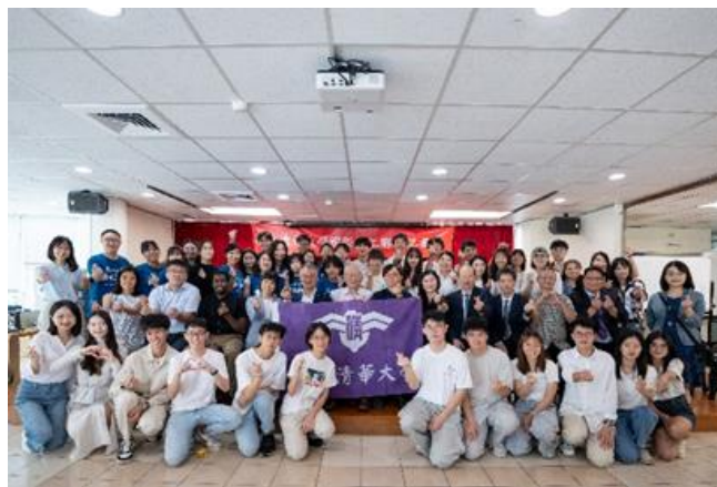
本校國際志工團即將出發前往海外服務。