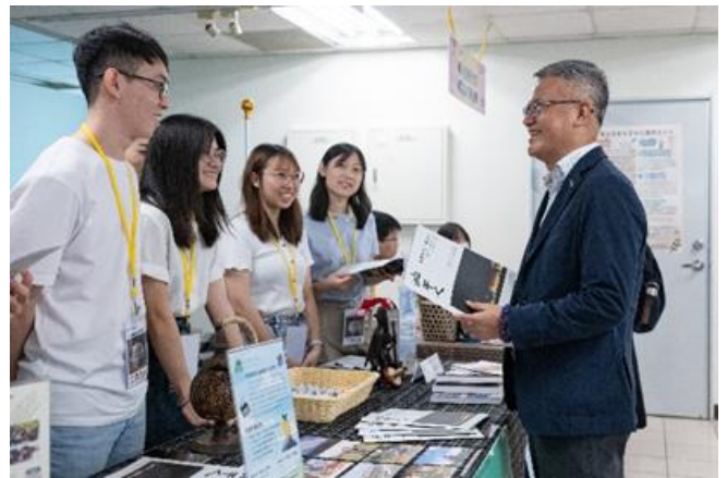
本校簡禎富副校長(右)勉勵國際志工。